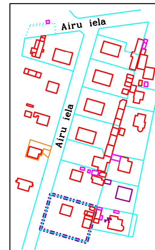
Dati apkopoti - 2023.gada 26.decembrī

Daudzdzīvokļu dzīvojamai mājai funkcionāli nepieciešamā zemesgabala novietojums zemes vienībā